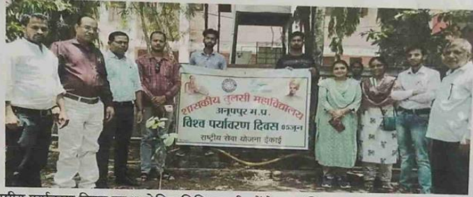
अन्तरराष्ट्रीय पर्यावरण दिवस पर आयोजित विविध कार्यक्रमों के छायाचित्र